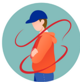
People at risk of trafficking and other forms of violence, exploitation and abuse, including migrants