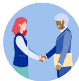
And our partners, including governments, private sector and civil society

Si vous souhaitez en savoir plus sur la traite des êtres humains ou si vous souhaitez aider une victime potentielle, n'hésitez pas à prendre contact avec l'une des trois ONG spécialisées en charge de la lutte contre la traite en Belgique: Payoke à Anvers, Pag-Asa à Bruxelles et Surya à Liège. Si vous souhaitez signaler un éventuel cas de traite, vous pouvez le faire via ce site .