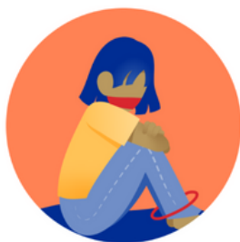
Migrants who have been subject to trafficking in persons

IOM works in support of three main groups in times of peace and crisis