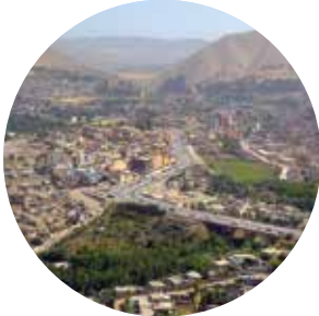
دھۆك